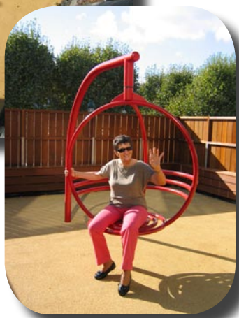
Parc des Expositions, Paris, Porte de Versailles, sept. 2011